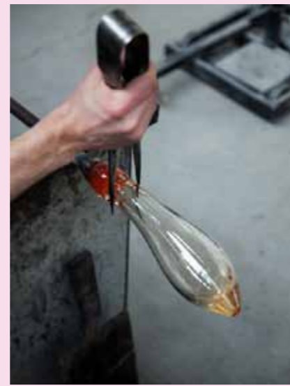
5 Mit einer Zange wird dann der Flaschenhals herausgearbeitet.