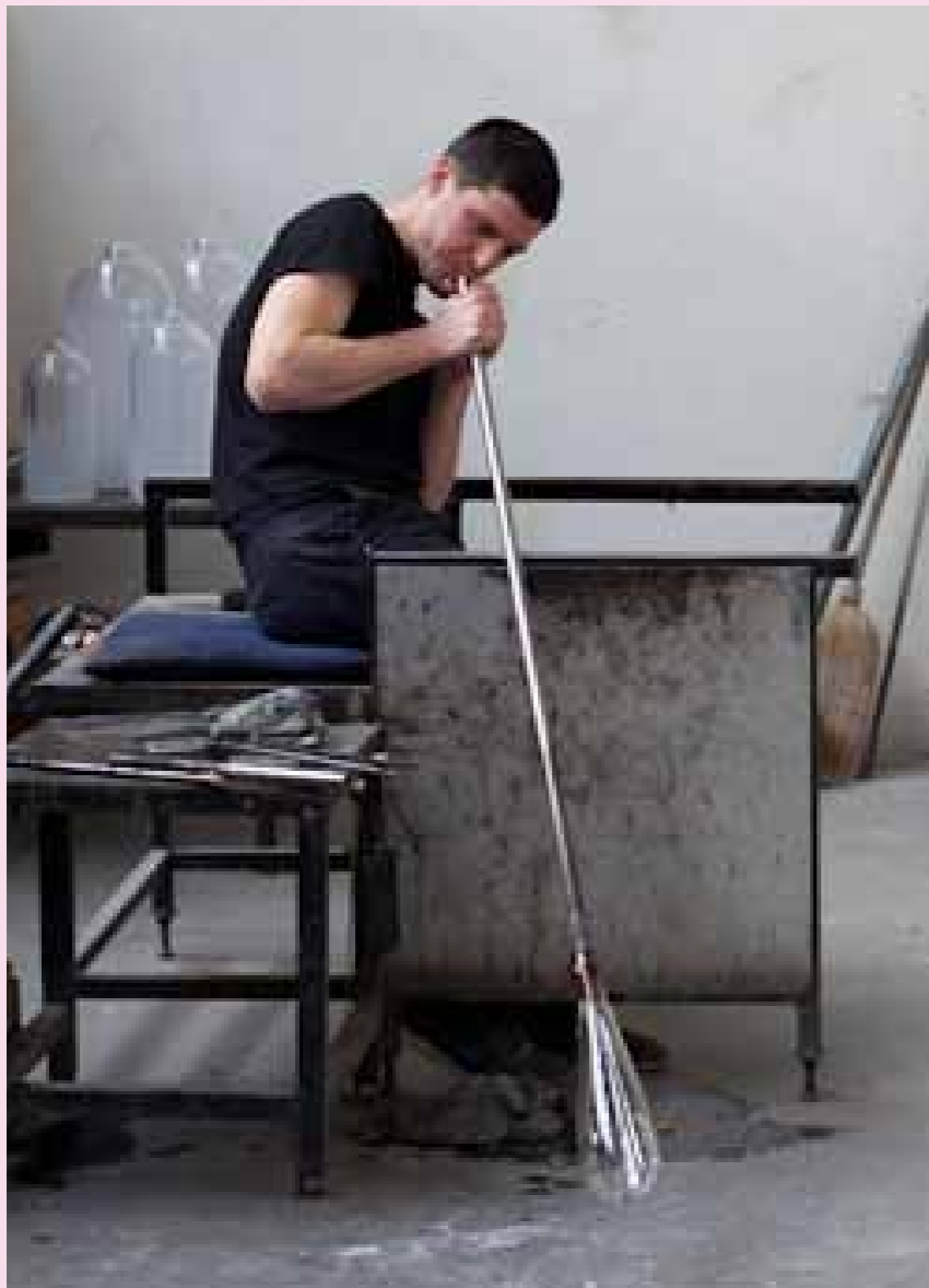
3 Mit dem Blasen entsteht Volumen.