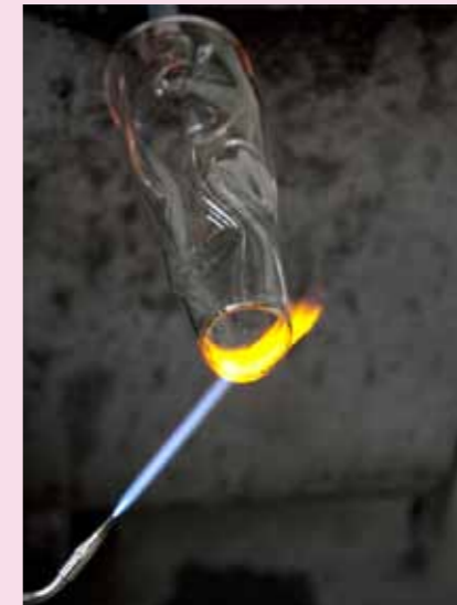
10 Mit Bunsenbrenner ...