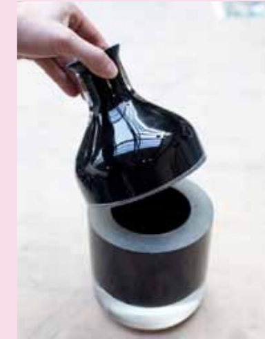
TEXT REBEKKA KIESEWETTER

D edication. Vielleicht ist es bezeichnend, dass es im Deutschen kein Wort gibt, das all das beinhaltet, was das englische Dedication umfasst: Hingabe, Einsatz, Widmung, Zielstrebigkeit ... Das kommt wohl aus einer früheren Zeit. Aber auch heute noch sitzen eine ganze Menge kleiner preußischer Kobolde in klugen und weniger klugen Köpfen und wispern, dass Widmung nicht mit Zielstrebigkeit einhergehen könne oder – ein Fazit nach preußischer Logik – Sinnesfreude nicht mit Arbeitsmoral. Wer beim Arbeiten zu viel Freude verspüre, arbeite schlecht. Und sich spaßlos abzurackern sei normal, flüstern die fiesen Kerlchen und halten ihre Träger konsequent (gern mittels einer Waffe namens „schlechtes Gewissen“) von der Erreichung des eigentlichen Idealzustands ab. Trifft man dann doch einmal einen, der seine Arbeit mit Dedication verrichtet, dann gibt es wenig Sinnlicheres und Intensiveres, als ihm zuzuschauen. Es ist eine Mischung aus einem klitzekleinen Teil Neid („also DER hat jetzt in seiner Arbeit seine Berufung gefunden“) und einem großen Teil Bewunderung („der macht genau SEIN Ding“). Das Gefühl kommt einer temporären Verliebtheit nahe.