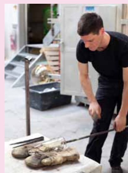
11 Die Karaffe wird von der Stange gelöst.