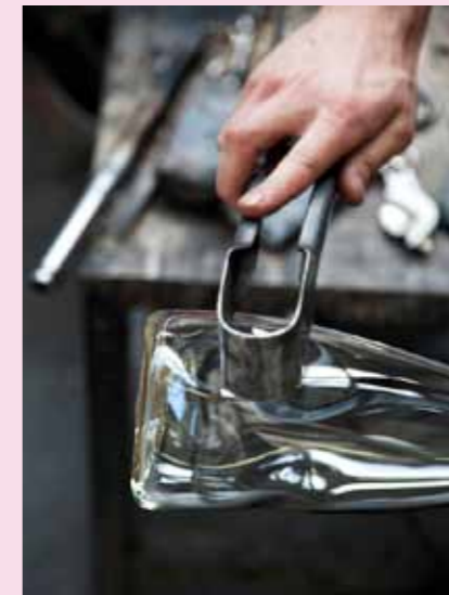
7 Mit dem hinteren Ende der Zange werden Dellen ins heiße Glas gemacht.