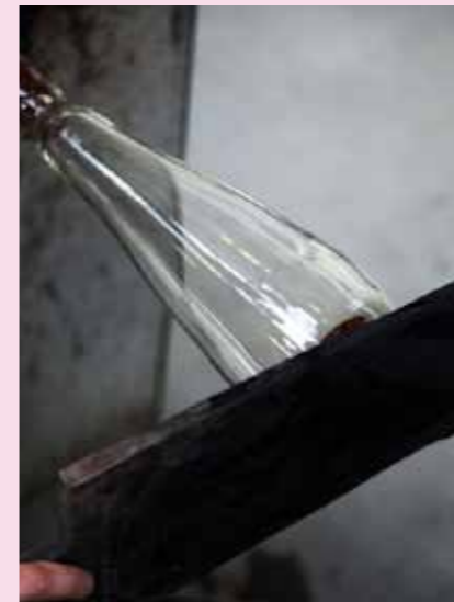
6 Der Boden wird mit einem Holzspachtel angedrückt.