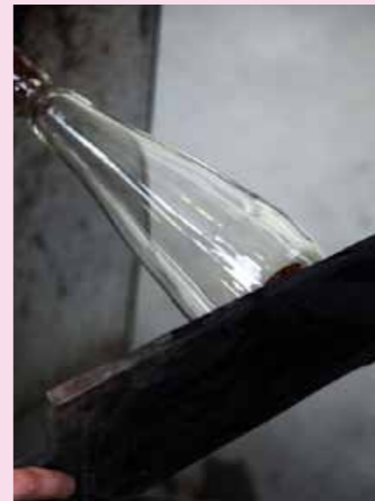
6 Der Boden wird mit einem Holzspachtel angedrückt.