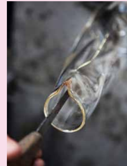
... und Zange werden Hals und Ausguss geformt.