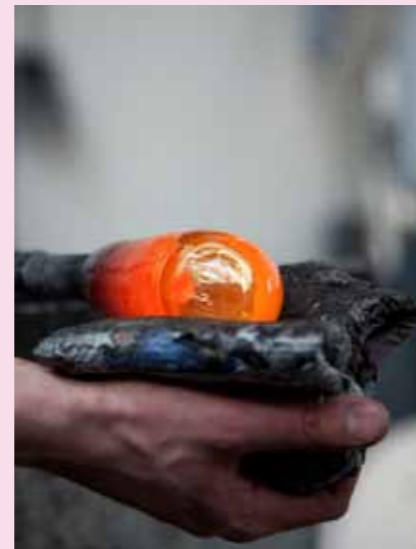
... und durch Drehen über einen Papierlappen wird es in eine erste Form gebracht.