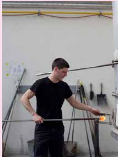
1 Das Glas ist ein kleiner glühender Klumpen, der an einem langen „Blas-Rohr“ hängt.