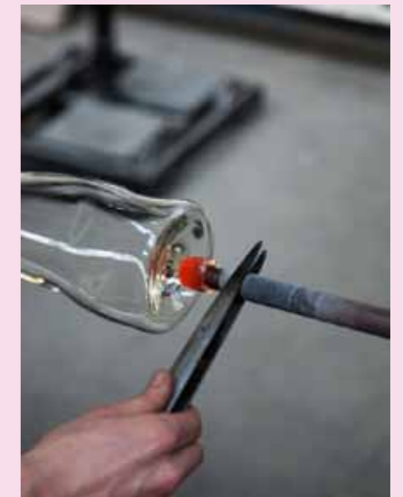
8 Eine Stange wird am Boden des Gefäßes befestigt, während das „Blas-Rohr“ entfernt wird.