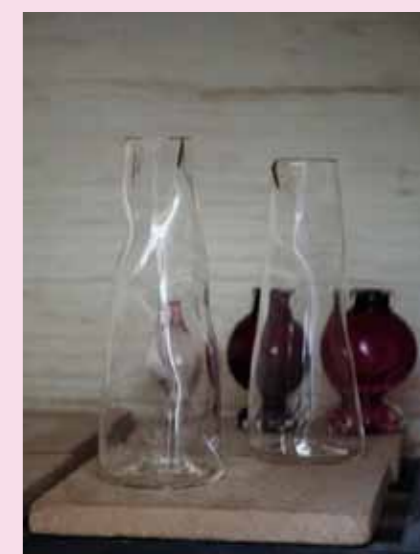
13 Zwei fertige Karaffen.