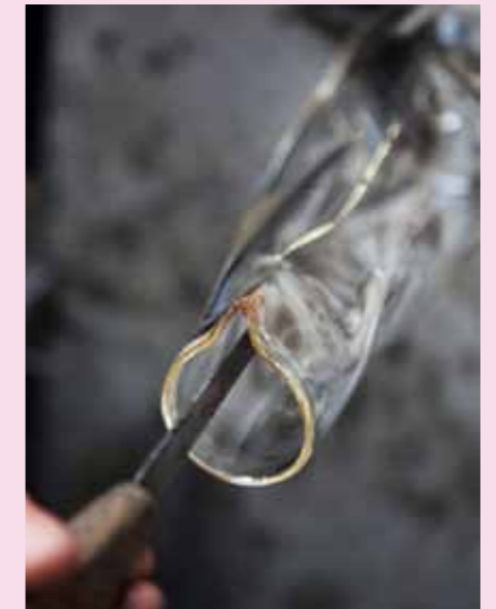
... und Zange werden Hals und Ausguss geformt.