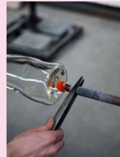
8 Eine Stange wird am Boden des Gefäßes befestigt, während das „Blas-Rohr“ entfernt wird.