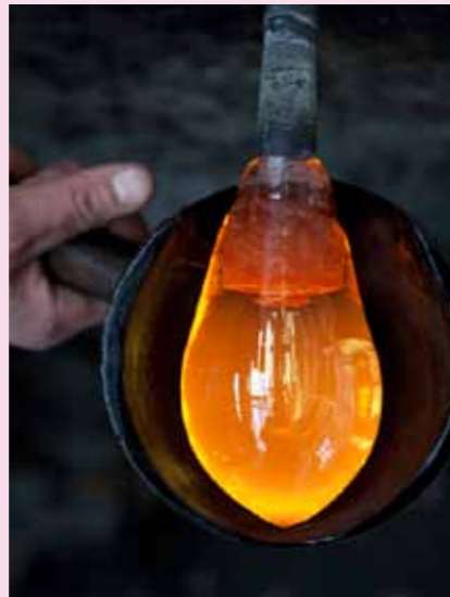
2 In einer mit Wasser gefüllten Holzform ...