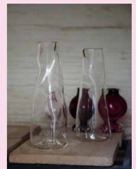
13 Zwei fertige Karaffen.