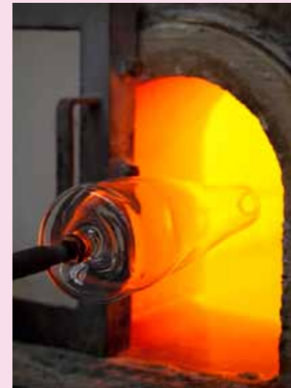
9 Das Glas wird ein weiteres Mal erhitzt.