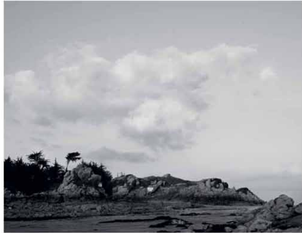
Die Landschaft liefert René das Material für Bilder, für kleine und große Objekte.

voraus. Wir entdecken ihn im Unterholz, wie er einen großen, zweibeinigen Holzstamm herauszieht. Er stellt ihn aufrecht vor sich, stabil und elegant gebogen, dreht ihn und streicht über die glatte Oberfläche. Nicht alles wird zu Kunst verarbeitet, vieles davon dient ihm zur Formfindung und zum Erkenntnisgewinn. Bis wir später vom Strand weiterziehen, stellt er den Fund aufrecht vor einen meteoritähnlichen Felsen. Wir setzen uns in den warmen Sand und schauen eine halbe Ewigkeit auf das Cap und die Umgebung. Die Ebbe hat kleine Siele hinterlassen, in denen das restliche Wasser glitzert. Ein paar Muschelsucher ziehen mit Eimern durch das weite Watt. Über das Szenario zieht warmes Licht wie ein Scheinwerfer durch die vorbeiziehenden Wolken. Die Felsklippen hinter uns verlieren ihre monumentale Präsenz, und René's Holz sieht plötzlich aus, als wollte es sich auf seinen zwei giraffenähnlichen Beinen in Bewegung setzen. „Verlangen nach Reinheit“ wird er die Skulptur später nennen.