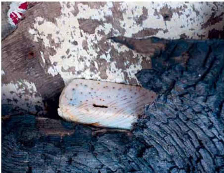
TEXT BEA CIEKOWSKA

Wolkengebilde fegen landwärts über das Meer und setzen ständig wechselnde Lichtakzente über die weite Landschaft der nordöstlichen Bretagne, der Côtes d'Armor. Wenn sich die Sonne am Horizont über das Meer ausdehnt, dann leuchtet das Wasser smaragdgrün wie in der Südsee. Die erstaunliche Helligkeit, die starken Kontraste, dieses ganz besondere Funkeln inspirierten schon viele Maler.