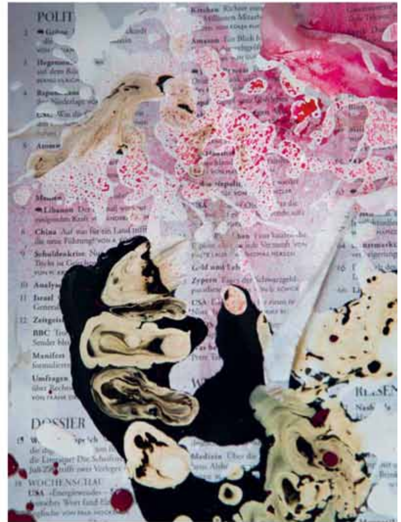
„Im Atelier riecht es nach Farbe, Brennholz und Meer.“